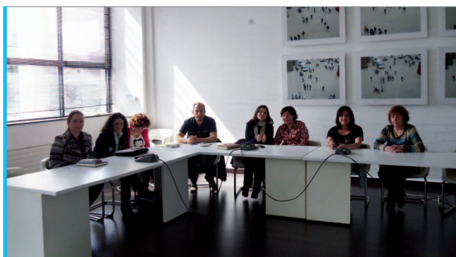
Fene foi un dos Concellos que acolleu as xuntanzas da Rede Municipalista Solidaria.