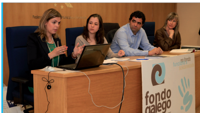
Dúas técnicas portuguesas presentaron o proxecto europeo 'Redes para o desenvolvemento' ante a Asemblea.