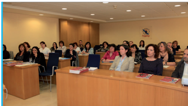
Representantes do Fondo Galego nas Deputacións e Concellos socios participaron na Asemblea Xeral.