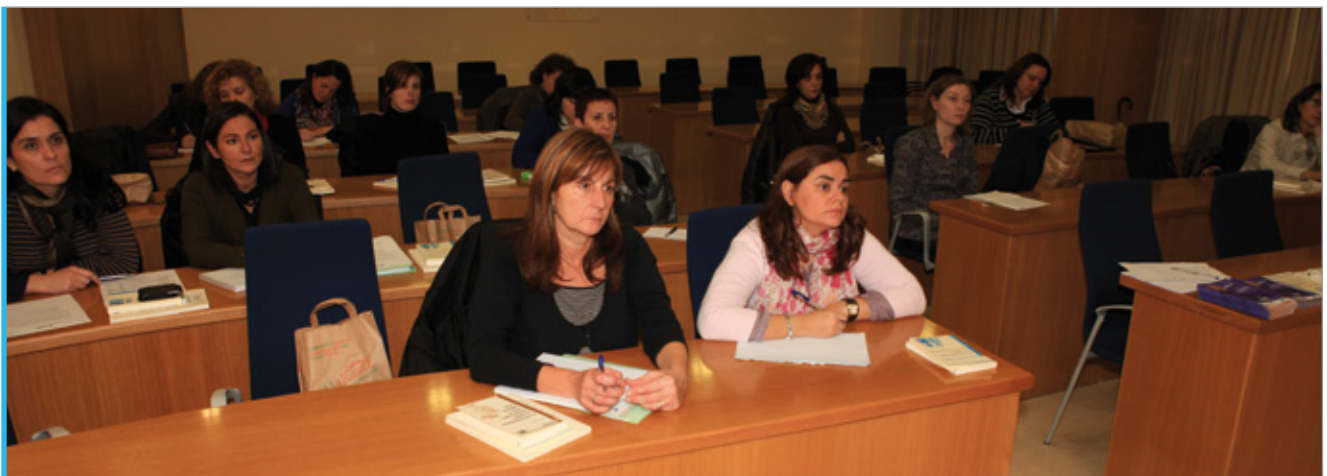
A Rede Municipalista Solidaria reúne persoal dos Concellos e Deputacións socias do Fondo Galego.

A técnica de Proxectos ofreceu asemade información actualizada sobre as iniciativas que nestes intres se apoian en Cabo Verde, Nicaragua e Haití. Tamén se revisaron as actuacións do departamento de Comunicación e animouse aos Concellos e Deputacións a visibilizar o labor do Fondo Galego con accións tan sinxelas como incorporar un banner no web institucional ou interactuar na páxina de Facebook.