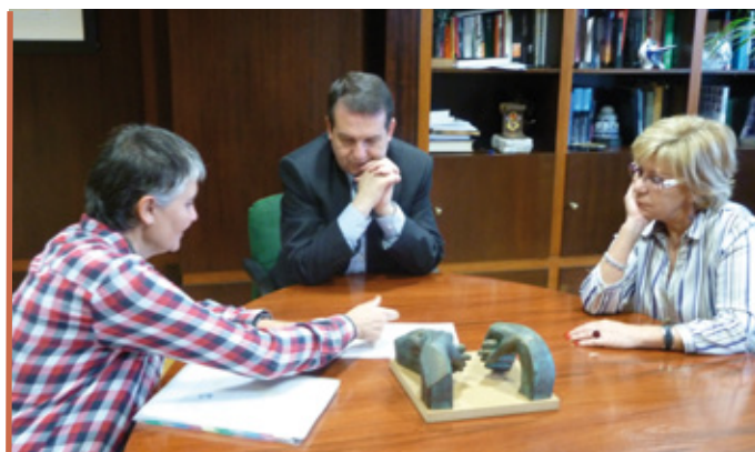
Victòria Planas explicoulles o proxecto ao alcalde de Vigo, Abel Caballero, e mais á concelleira e vicepresidenta do Fondo, Isaura Abelairas.