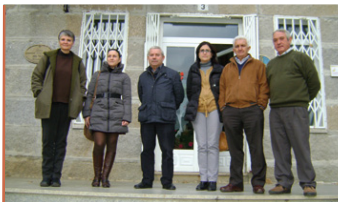
As técnicas do Fons Català e do Fondo Galego informaron ao alcalde de Oímbra e a integrantes do equipo de goberno sobre os avances en Haití.