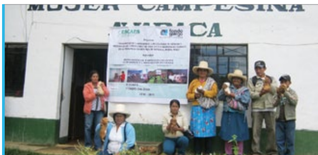
Familias beneficiarias na sede de Escaes, cos cuyes.