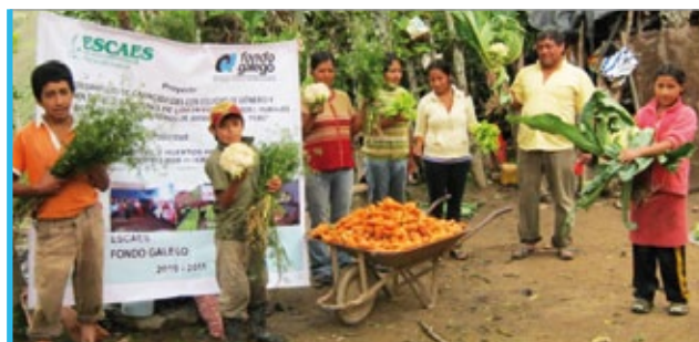
O proxecto permitiu incrementar a produción hortícola.

□ A ONGD Amigos ESCAES Perú e o Fondo Galego de Cooperación e Solidariedade promoveron a alfabetización e unha correcta alimentación en nove comunidades rurais da provincia de Ayabaca, departamento de Piura. A iniciativa desenvolvida no país andino con familias en situación de pobreza extrema recibira 35.000 euros da asociación de Concellos e Deputacións na convocatoria de proxectos de 2010.