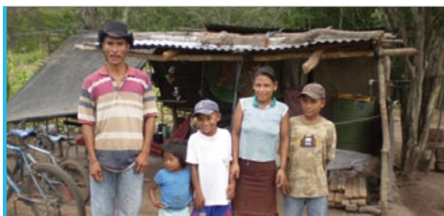
Once familias indíxenas disporán dunha vivenda digna grazas ao proxecto en San José de Palmira.