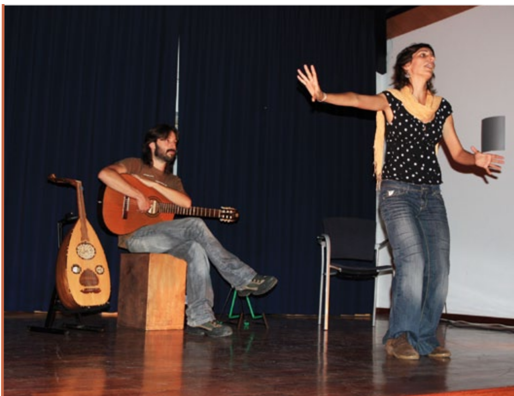
Os 'Contos coas mans abertas' da Tropa de Trapo sensibilizarán sobre a solidariedade internacional por toda Galicia

Que mensaxe lanzariades a aqueles Concellos que aínda non vos acolleron? A quen organiza, dámoslle ánimo porque dá traballo e non é doado conseguir que os adultos veñan a un contacontos. Pero que o intenten porque logo todos quedamos contentos, así que vale a pena o esforzo. E ao público animámolo a acudir porque se non vanse arrepentir... Sempre está ben reflexionar, soñar un chisco, xogar a ser pequenos e deixarse levar. Estes non son contos de heroes, os protagonistas son xente coma nós, que fixo unha cousa pequena que está na man de calquera, e iso sempre anima a dar ese pasiño que fai falta.