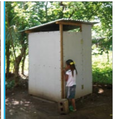
Unha nena acode a unha das latrinas construídas en Tepalón

Por outra banda, a través da convocatoria de proxectos de cooperación indirecta de 2010, o Fondo Galego subvencionou con 6.750 euros a construción de 30 latrinas na comunidade nicaraguana de Tepalón.