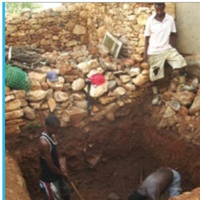
As familias beneficiarias executaron as obras para instalar os baños en Maio

A través dun proxecto de cooperación directa coa Cámara Municipal do Maio, en Cabo Verde, instaláronse cuartos de baño en 53 vivendas das localidades de Figueira e Ribeira Don João. A iniciativa contou co apoio económico da Xunta de Galicia. Entre ambas as dúas entidades galegas achegaron 49.200 euros.