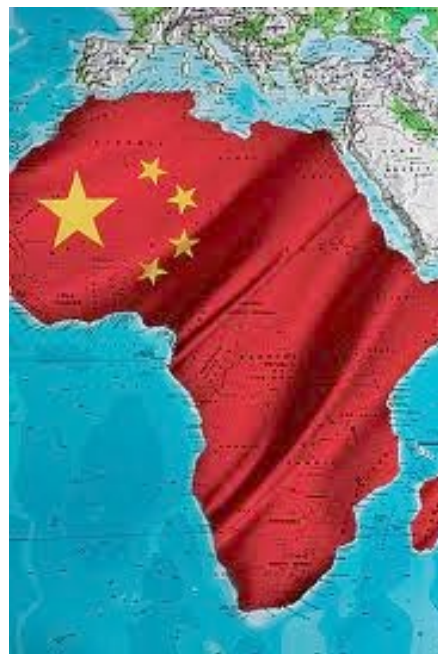
"China in Africa | photo illustration by Plamen Petkov" ( http://www.fastcompany.com/magazine/126/special-report-china-in-africa.html )

Desde su fundación la República Popular de China (R.P.Ch.) prestó especial atención en el fomento de vínculos de amistad y cooperación con el Tercer Mundo. Estas relaciones se